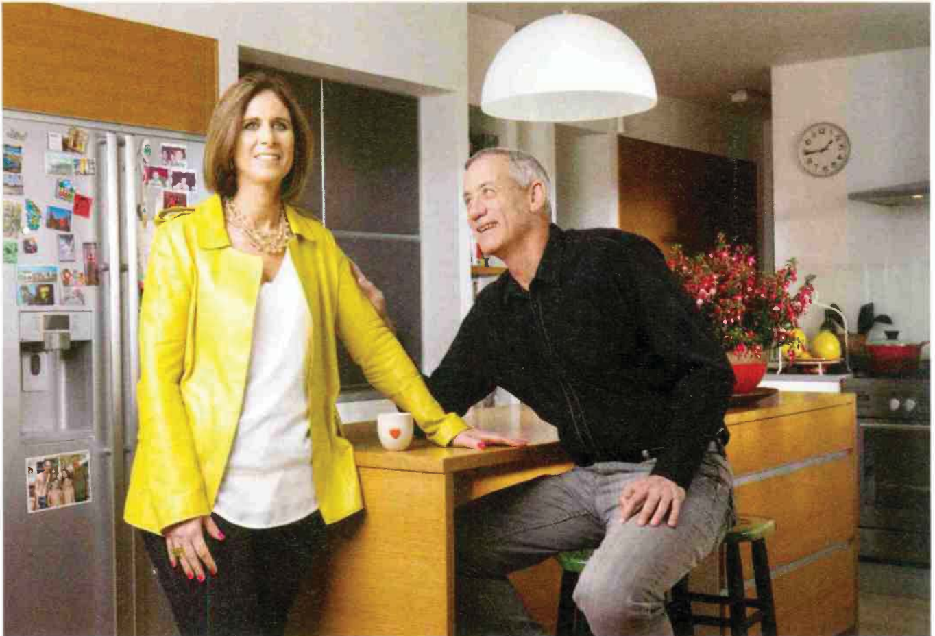
איפור: טלי אהרון