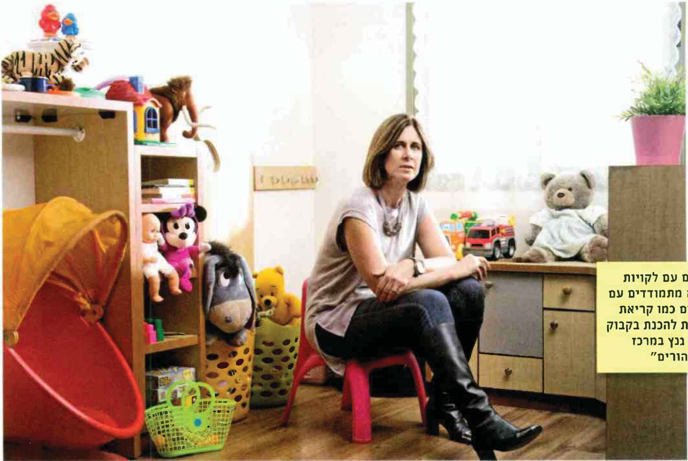
"הורים עם לקויות למידה מתמודדים עם אתגרים כמו קריאת הוראות להכנת בקבוק חלב". גנץ במרכז "ניצן הורים"