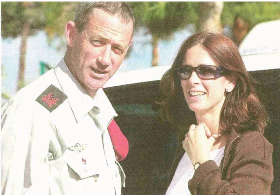
עם בעלה, כשהיה אלוף. "לתפקיד של אלוף גדלים כמשפחה. אני משהיית לקבוצה הזו כבר עשר שנים"

הזיכרון, למרות שאירגנו שם טקס, אמרתי, זה יום שבו אני מרגישה שאני רוצה להיות בארץ, שאני לא נמצאת במקום שאני שייכת אליו. הרמתי את הטל' פון והתקשרתי לכל האנשים שאנחנו תמיד נוסעים אליהם. אמרתי להם, אני מתקשרת בשביל עצמי, לא בשבילכם."