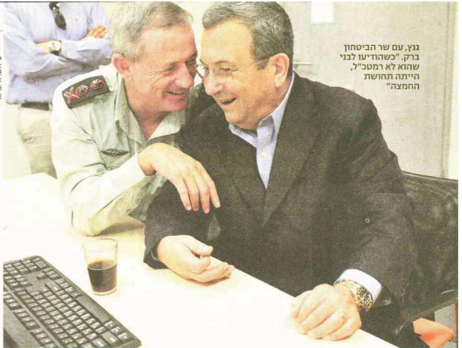
גנץ, עם שר הביטחון ברק. "כשהודיעו לבני שהוא לא רמטכ"ל, הייתה תחושת החמצה"