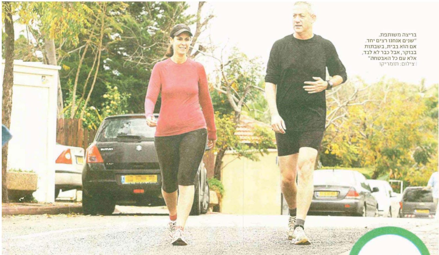
בריצה משותפת. "שנים אנוחנו רצים יחד. אם הוא בבית, בשבתות בבוקר, אבל כבר לא לבד, אלא עם כל האבטחה"